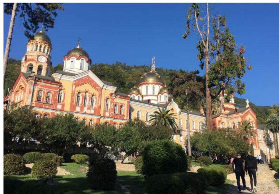
Святые Нового Афона связаны с одним из 12 апостолов Иисуса Христа - Симоном Кананитом.

рабатывать еще школьником. Сейчас Бганба - депутат Гагрского районного собрания, председатель Комиссии по развитию абхазского языка, культуры и охране памятников историко-культурного наследия.