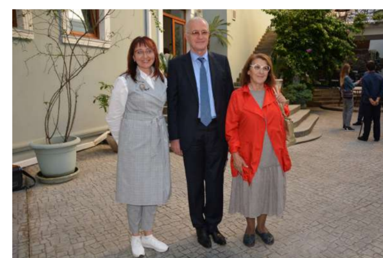
С министром культуры и туризма Автанდიлом Гарцкией.

У Абхазии богатое православное прошлое и настоящее, что тоже нас очень роднит. И связано оно прежде всего с одним из двенадцати апостолов Иисуса Христа - Симоном Кананитом, который прибыл на Иверскую землю вместе с Андреем Первозванным, чтобы проповедовать христианство, и принял здесь мученическую смерть от иноверцев.