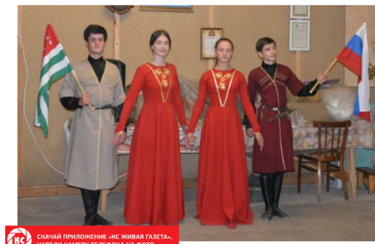
СНАЧАЙ ПРИЛОЖЕНИЕ «НС ЖИВАЯ ГАЗЕТА», НАВЕДИ КАМЕРУ ТЕЛЕФОНА НА ФОТО

Но задача министра Гарцкия - рассказать о своей стране новому поколению туристов. А для них будет важно, что это безвизовое пространство, пересечь границу можно по