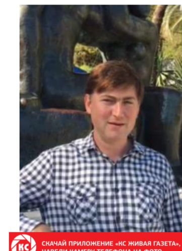
СНАЧАЙ ПРИЛОЖЕНИЕ «НС ЖИВАЯ ГАЗЕТА», НАВЕДИ КАМЕРУ ТЕЛЕФОНА НА ФОТО

В селе Дуринги можно поучаствовать в абхазском застолье с песнями и танцами.