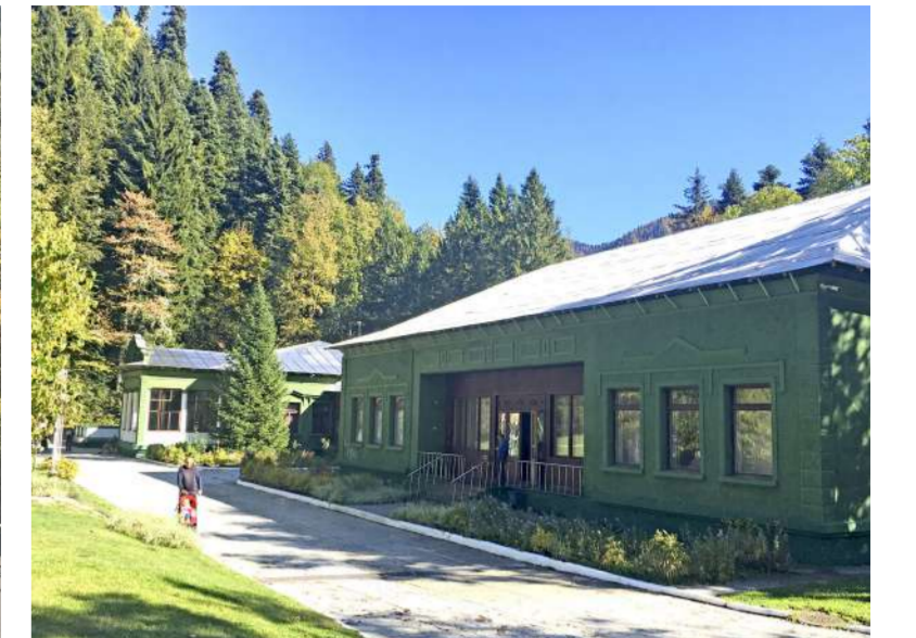
Таинственная дача Сталина на озере Рица открыта для посещения туристов.

Наверное, я все-таки нетипичный турист. Еще в прошлое мое посещение рицинского национального парка меня больше всего заинтересовала дача Сталина.