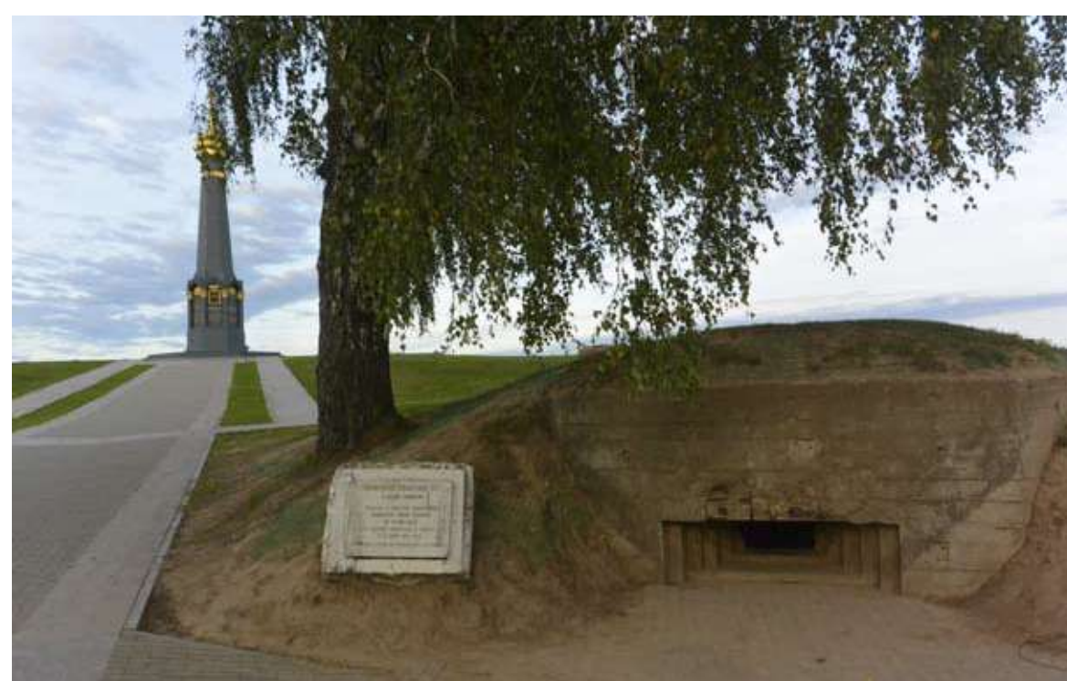
Бородинское поле - место генерального сражения Отечественной войны 1812 года и тяжелых оборонительных боев 1941-го.

Петра Ивановича вынесли с поля боя. На следующий день отправили в Москву, а 19 сентября полководца перевезли в село Сима Владимирской губернии. В Симе было именные друга Багратиона, также участника Бородинского сражения - генерал-лейнанта князя Бориса Голицына. Рана оказалась смертельной. Спустя семнадцать дней после битвы, в первом часу пополудни Пётр Иванович скончался от гангрены. Похоронили его в местном храме - недалеко от голицынского особняка.