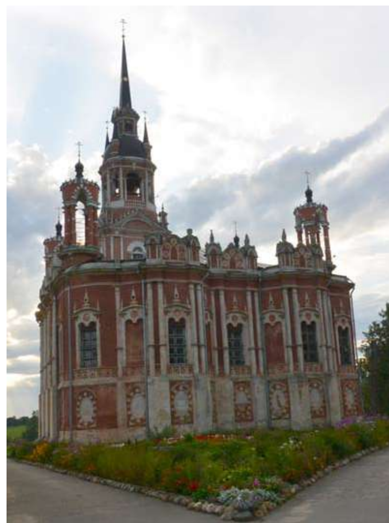
Ново-Никольский собор - главная историческая достопримечательность Можайска.

Господа, вы не были в Можайске? Участники медиатура, организованного Альянсом руководителей региональных СМИ России (АРС-ПРЕСС), настоятельно рекомендуют посетить этот небольшой подмосковный городок, здесь есть что посмотреть, о чем послушать, над чем подумать. Тут, знаете ли, история творилась. Для нас, владимирцев, это путешествие может стать особенно увлекательным. Невидимые нити собирают в причудливую ткань летопись государства Российского, имена героев связывают старые города, запорошенные сегодня новостями аллюзии дают пищу для размышлений о судьбах Отечества.