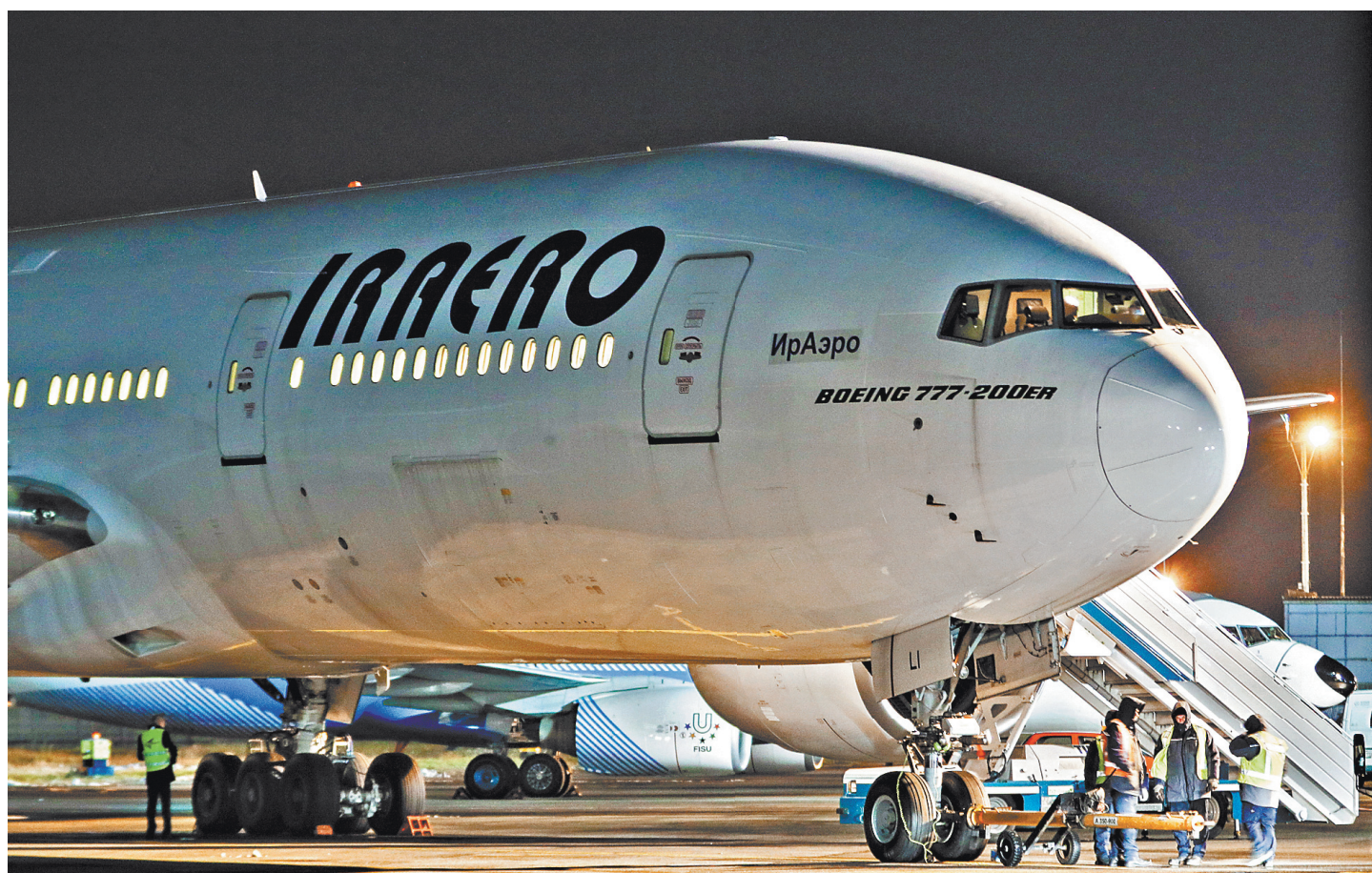
Туроператор выписывал маршрутные квитанции на несуществующие рейсы.

По мнению директора «Турпомощи», часть функций контроля могла бы взять на себя сама ассоциация, часть — региональные структуры, отвечающие за туризм, часть — Ростуризм. Это