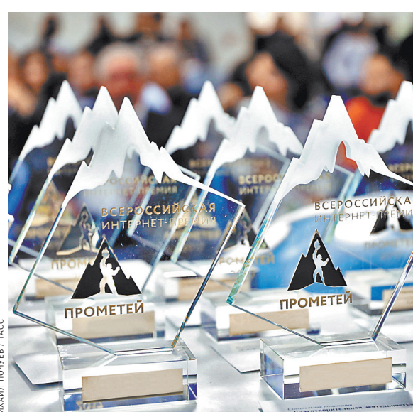
Онлайн-сервис «Юридическая консультация» стал лучшим в спецноминации «Просвещение».

Вчера в пресс-центре ТАСС состоялся награждение лауреатов Всероссийской интернет-премии «Прометей-2018». Конкурс проводится уже в восьмой раз, его главная задача — поддержать инициативы в сфере digital, которые делают мир вокруг нас проще, удобнее и интереснее. Премией награждаются сайты, мобильные приложения и интернет-проекты за технологический, культурный, социальный, образовательный вклад в жизнь общества. Организаторами конкурса традиционно выступают Центр развития цифровых технологий «Прометей» и информационное агентство ТАСС.