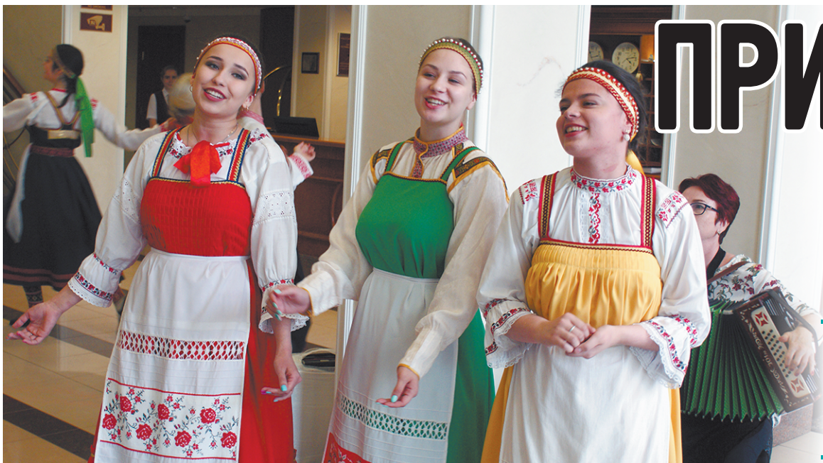
Ансамбль «Пелысь-Мольяс» («Рябиновые бусинки»)