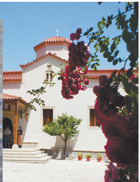
Монастырь Преображения Господня.