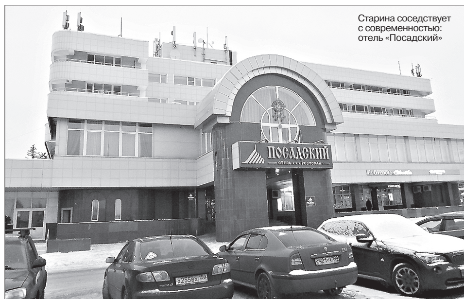
Старина соседствует с современностью: отель «Посадский»

Затем нам так не терпелось посетить Лавру, что мы поспешили до неё прогуляться (благо, и отель, и ресторан, и Лавра – всё