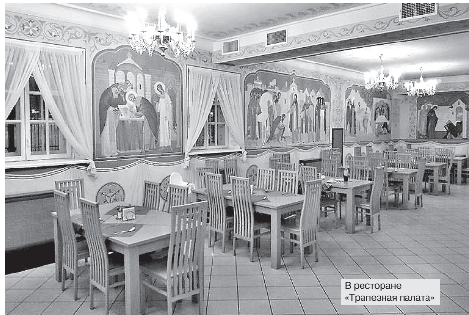
В ресторане «Трапезная палата»