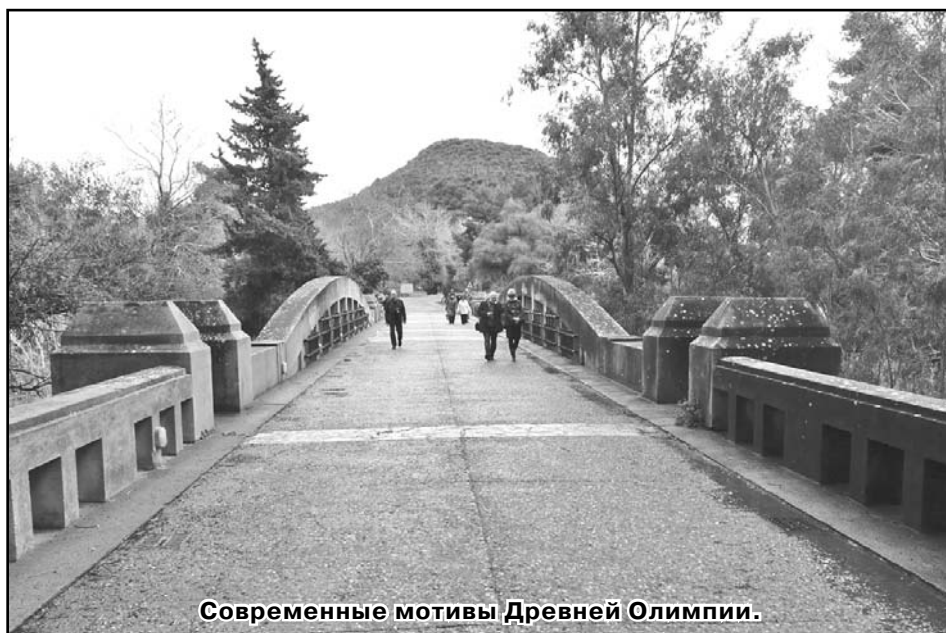
Современные мотивы Древней Олимпии.