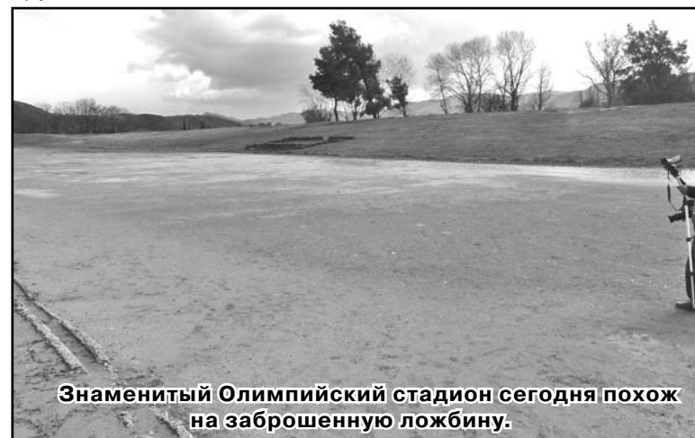
Знаменитый Олимпийский стадион сегодня похож на заброшенную ложбину.

Храм Геры был построен раньше храма Зевса и датируется 600 г. до н.э. Он представляет собой храм-периптер дорического ордера, внутри храма в 1877 г. найдена часть знаменитой