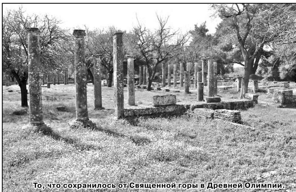
То, что сохранилось от Священной горы в Древней Олимпии.